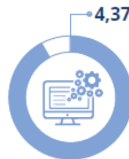
Facilità utilizzo applicativo online Scala valore da 1 a 5