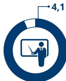
Valutazione docenti Scala valore da 1 a 5

Leggi qui i feedback completi della prima edizione